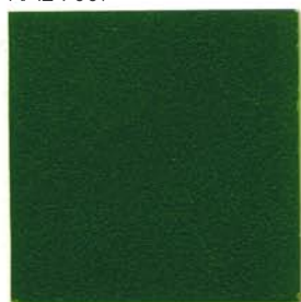
VERT 500 SABLE