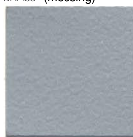
MATT CHROME EPOXY