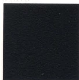
RAL 9005 EFFECT