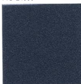
BLEU 700 EFFECT