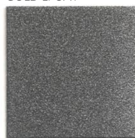
RAL 9007 EFFECT