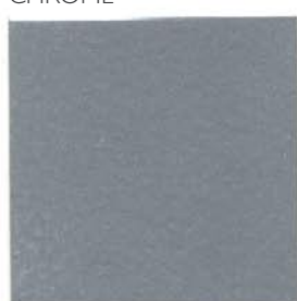
RAL 9006 KIDE